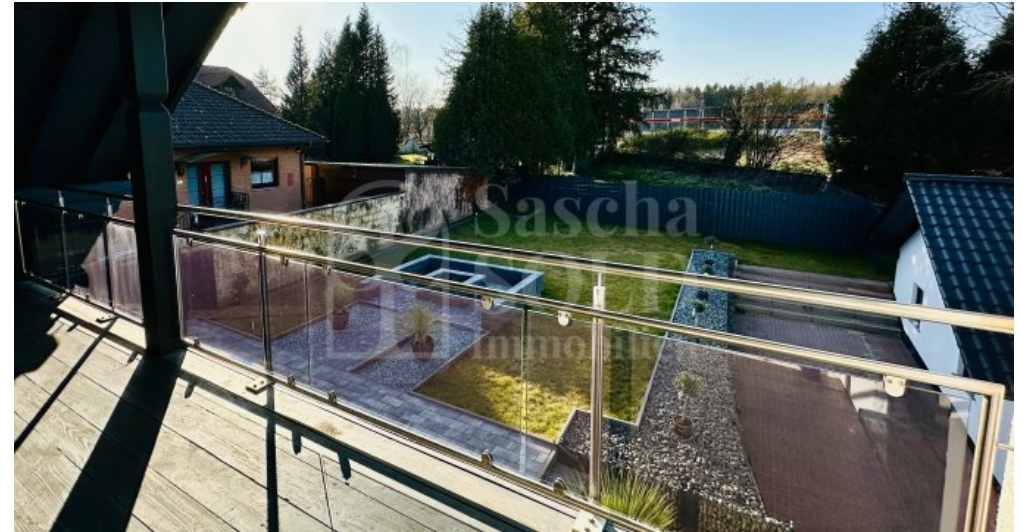
WE im DG - Loggia