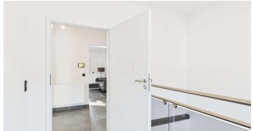
DG - Diele