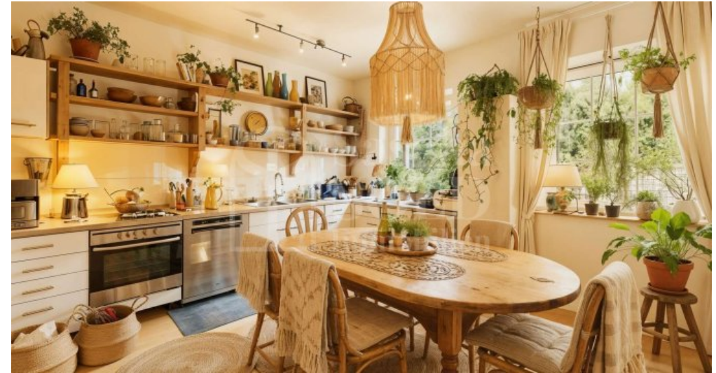
Küche - Einrichtungsbeispiel