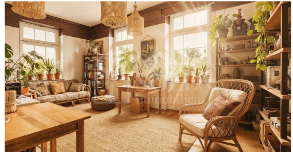
Wohnzimmer/Homeoffice - Einrichtungsbeispiel