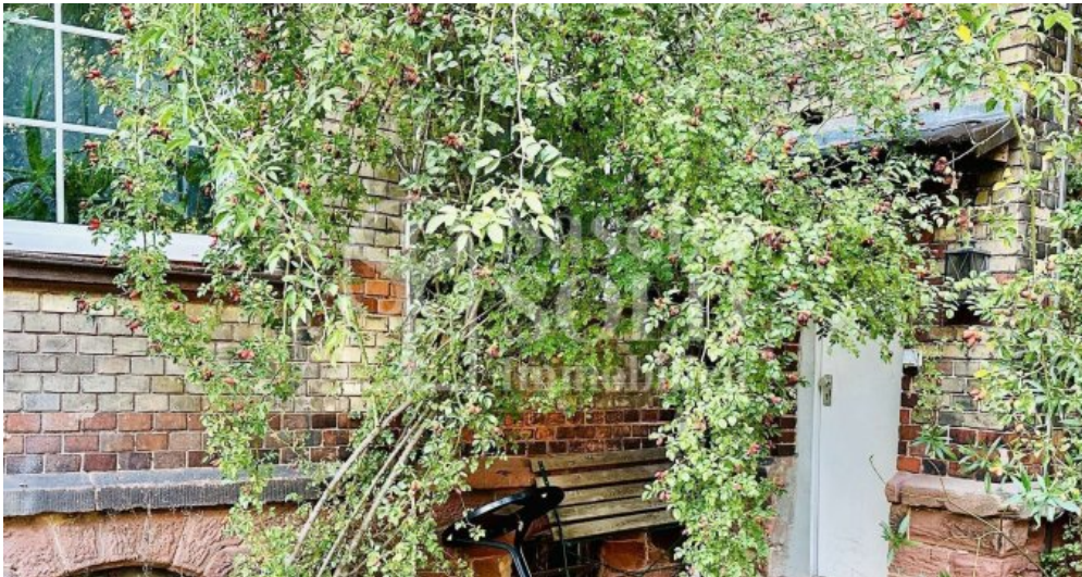
Sitzecke im Grünen