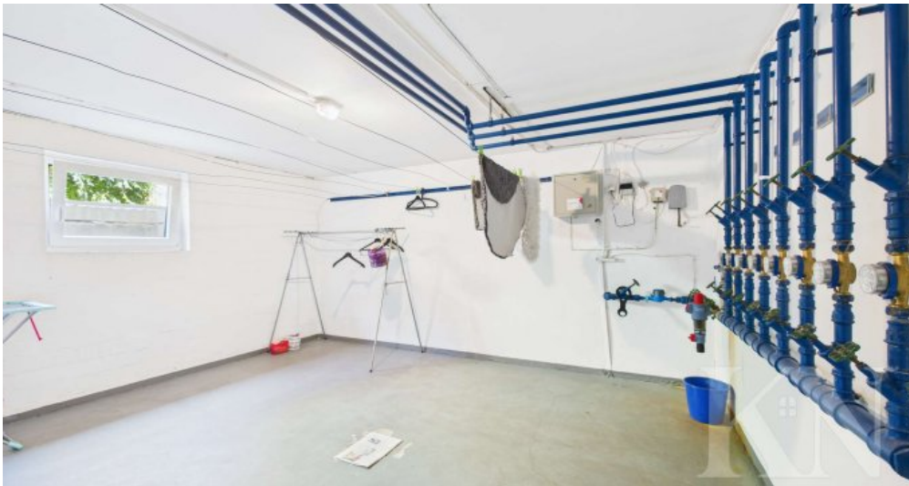
Keller / Waschraum