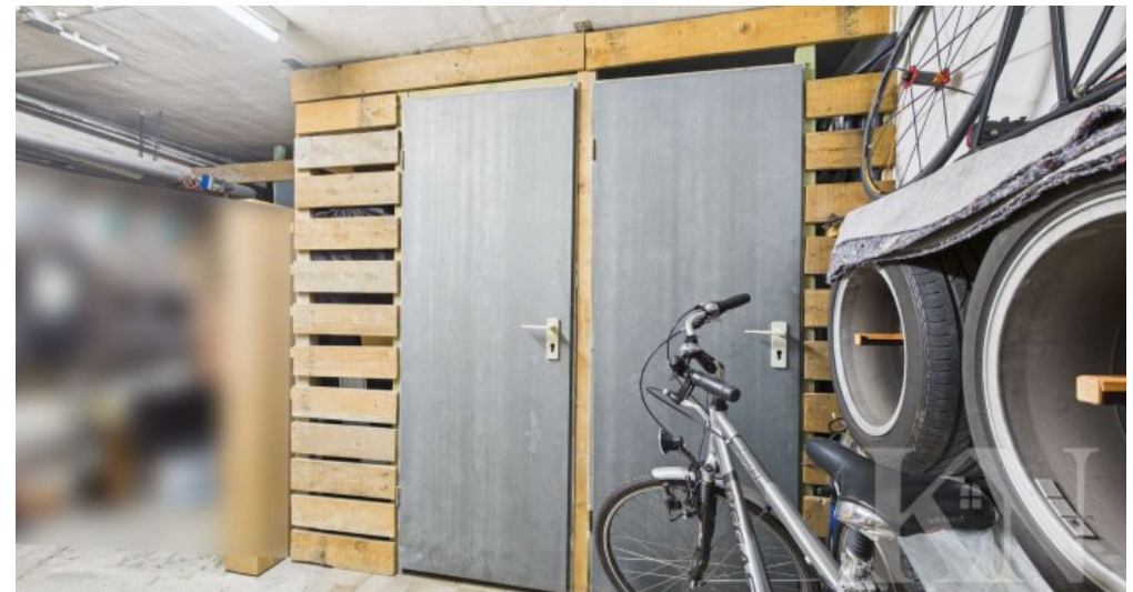
Kellerraum / Kellerabteil