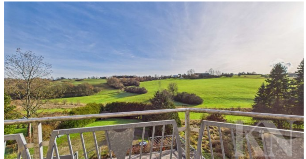
Aussicht vom Balkon