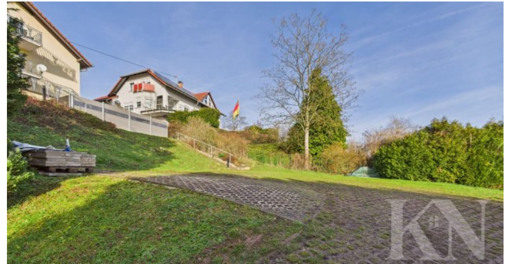
Stellplätze hinter dem Haus