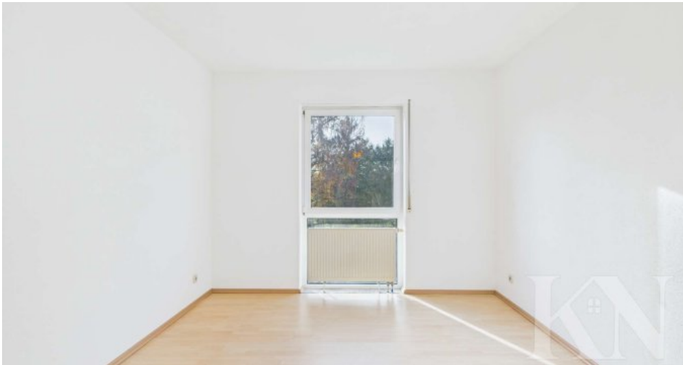
Büro / Kinderzimmer