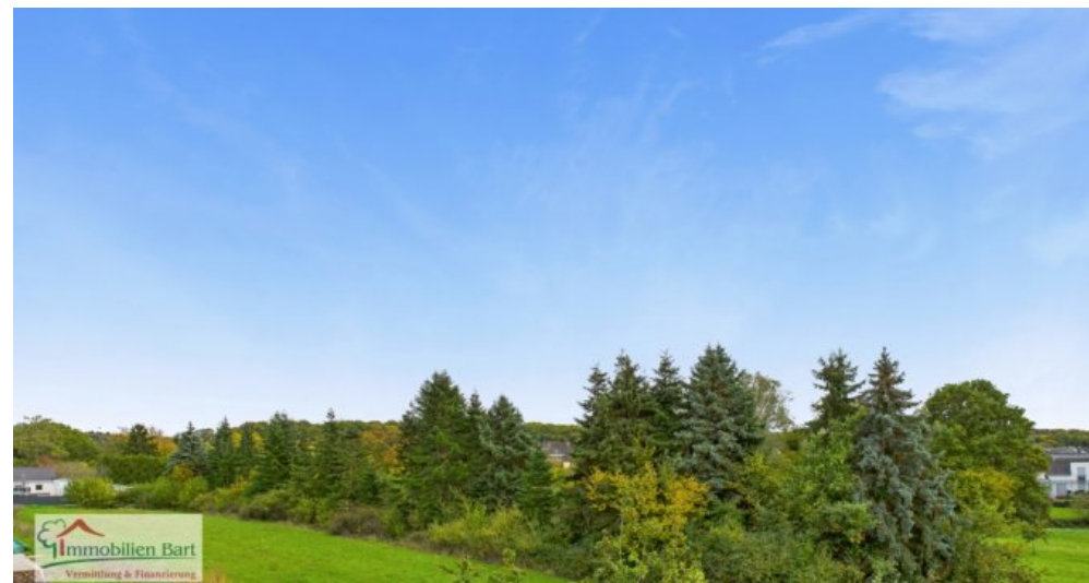
mit Blick ins Grüne