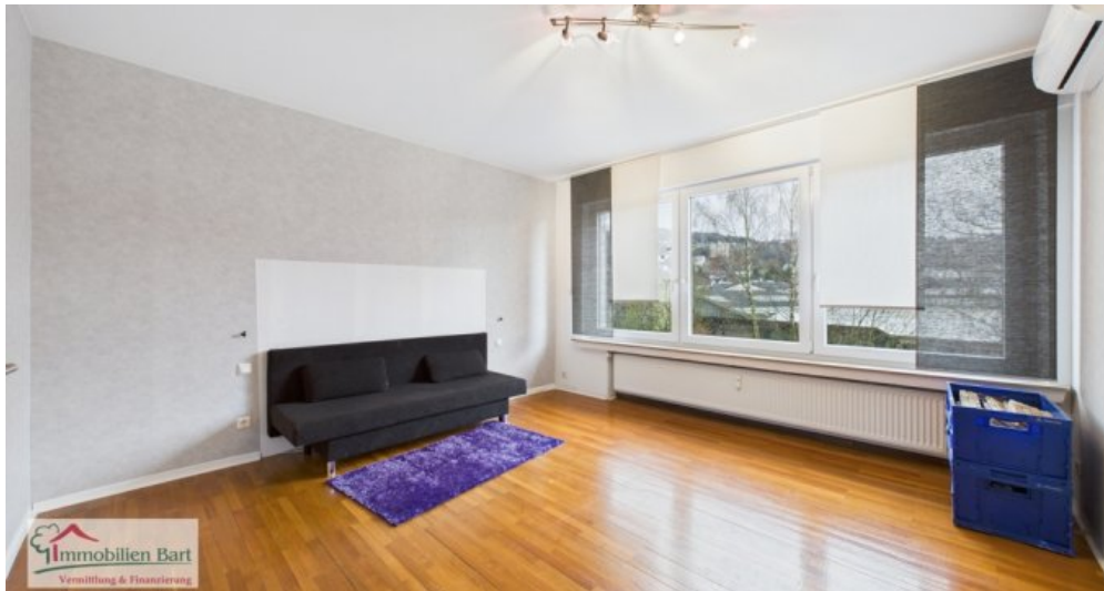
OG - Schlafzimmer