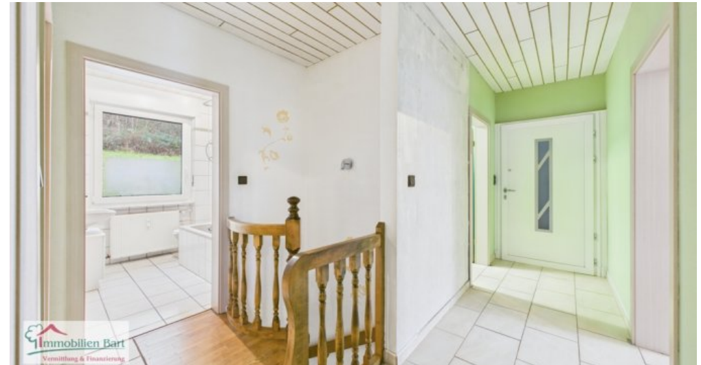
OG - Diele