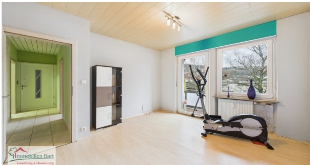
OG - Schlafzimmer