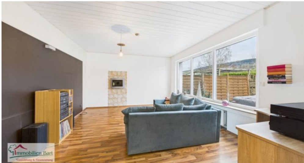
EG - Wohnzimmer (2)