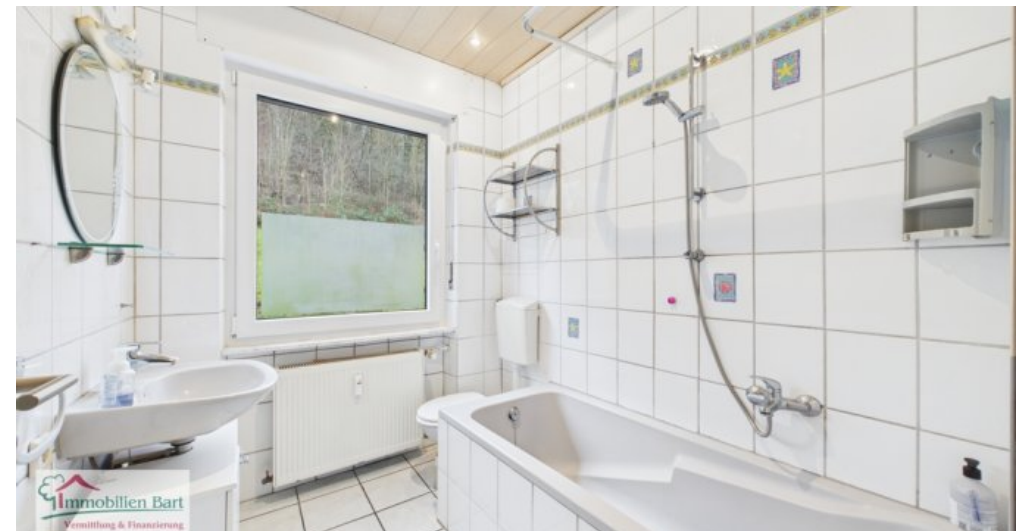
OG - Badezimmer