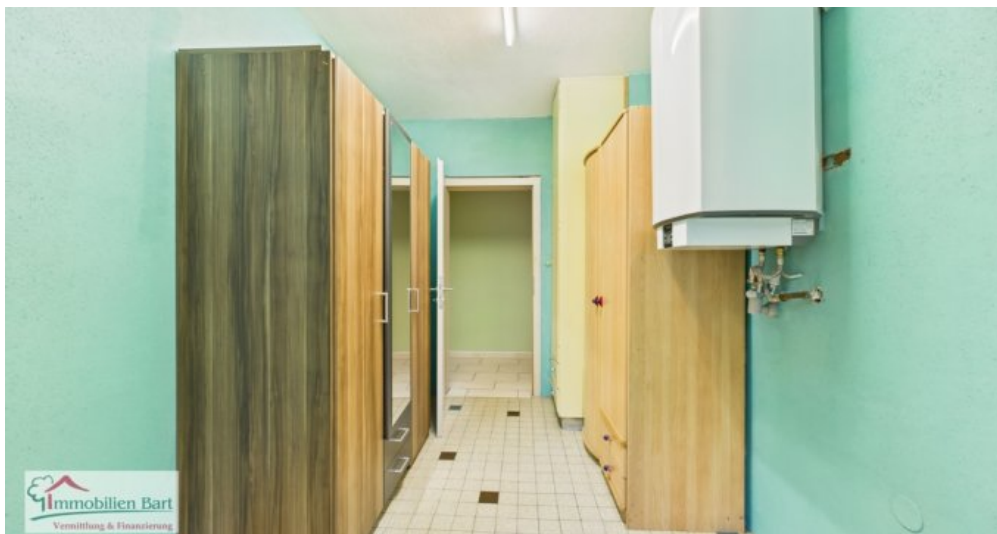
OG - Hauswirtschaftsraum