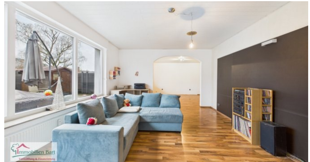
EG - Wohnzimmer