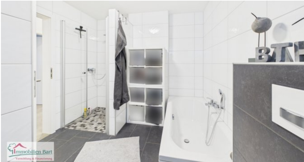
Bad mit Dusche und Wanne