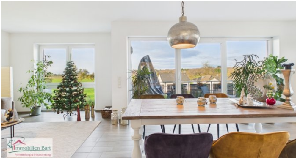
Essbereich mit Ausblick