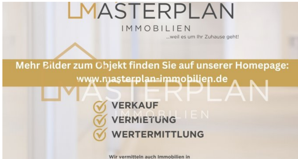
Mehr Bilder auf unserer Homepage