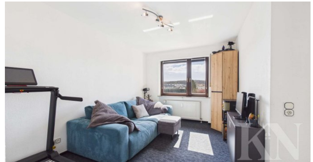
Büro / Gästezimmer