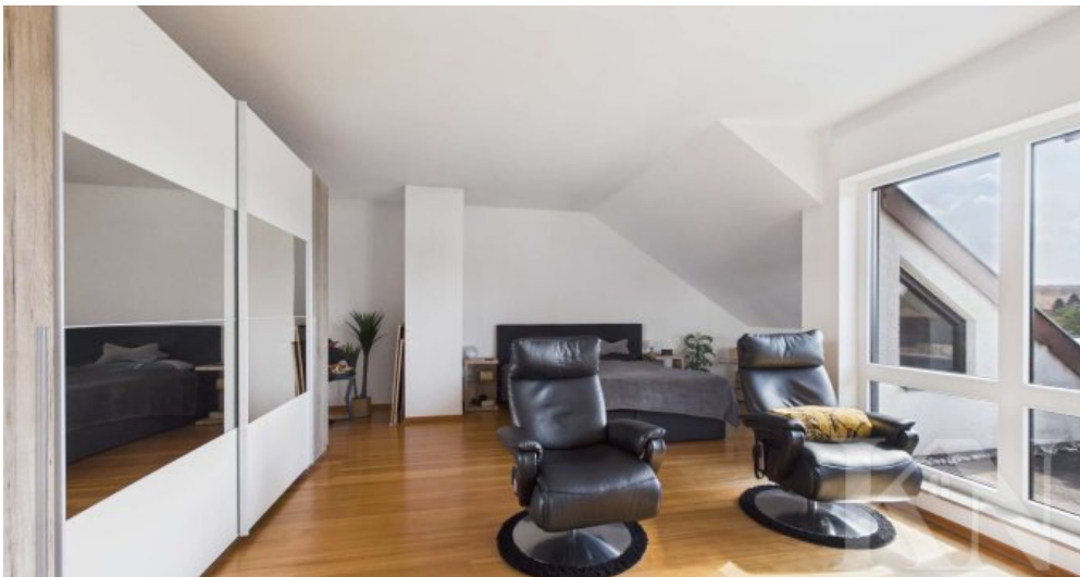
Wohn und Schlafbereich