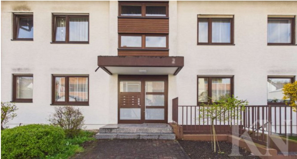
Haus Ansicht Front