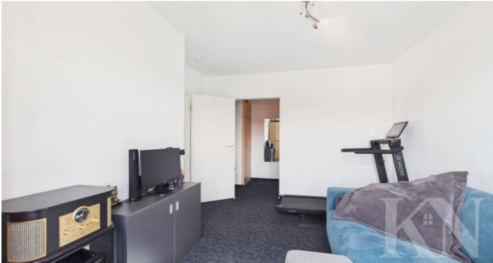
Büro / Gästezimmer