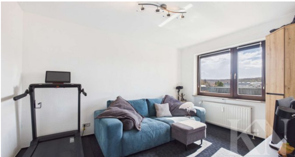
Büro / Gästezimmer