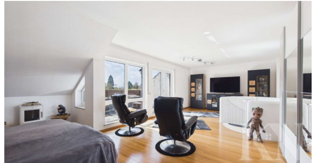
Wohn und Schlafbereich