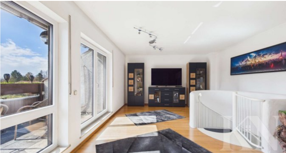
Wohn und Schlafbereich