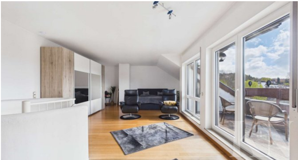
Wohn und Schlafbereich