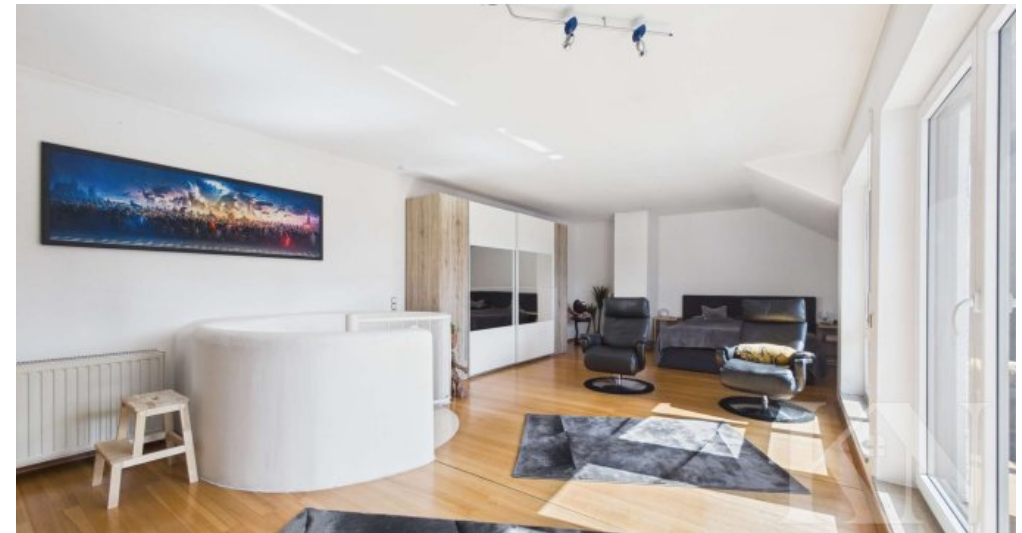
Wohn und Schlafbereich