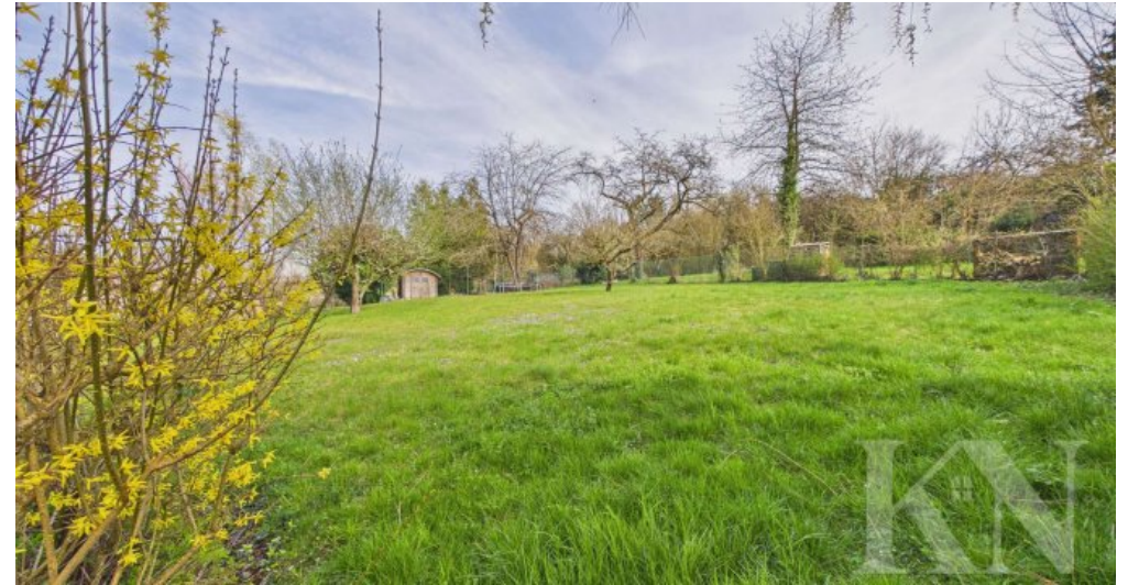
Garten - zur Gartenmitbenutzung