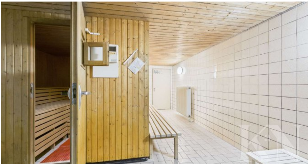
Gemeinschaftlicher Fitness & Sauna Raum