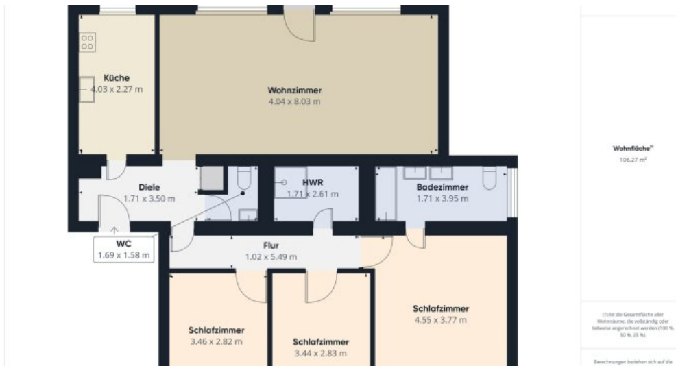
Grundriss 2. OG