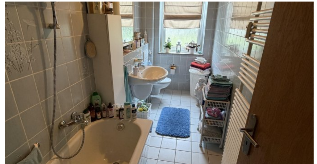
Wohnung (Nr. 2) Badezimmer