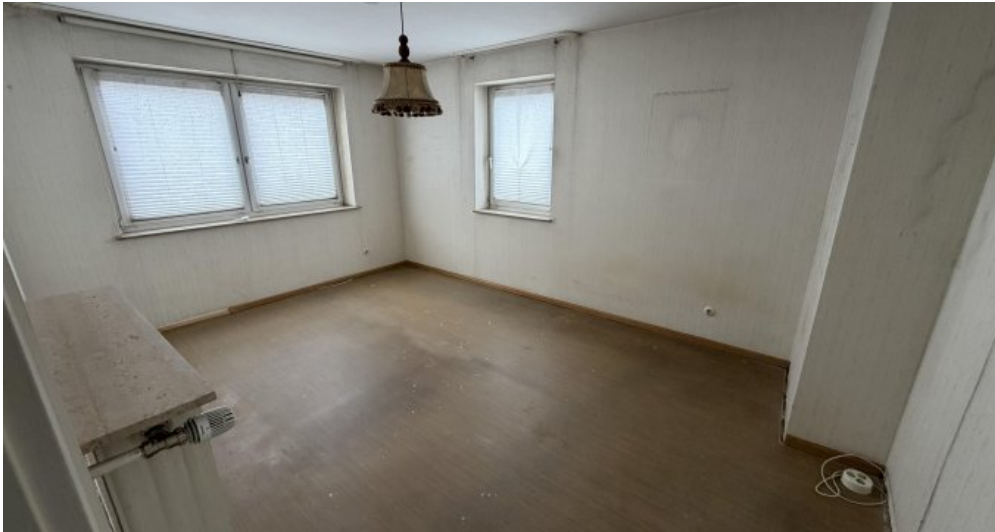
Wohnung (Nr. 4) Wohnzimmer