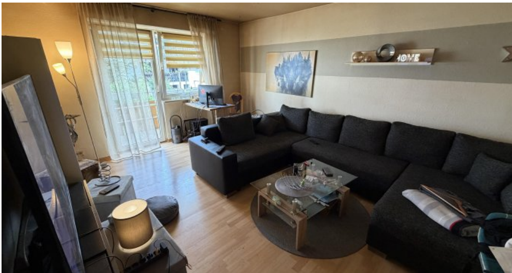
Wohnung (Nr. 3) Wohnzimmer