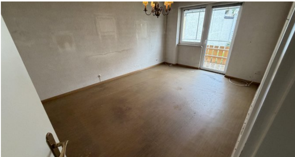
Wohnung (Nr. 4) Schlafzimmer