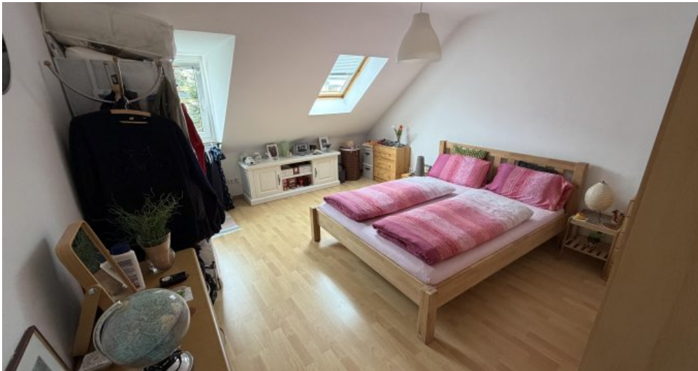
Wohnung (Nr. 6) Schlafzimmer