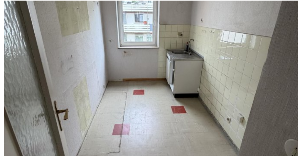
Wohnung (Nr. 4) Küche