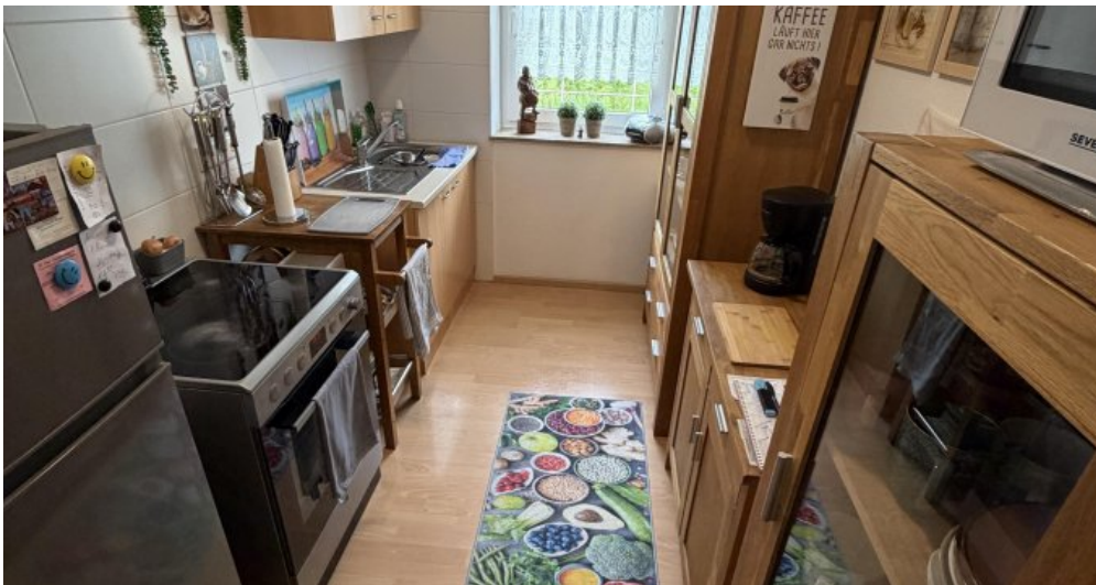
Wohnung (Nr. 2) Küche