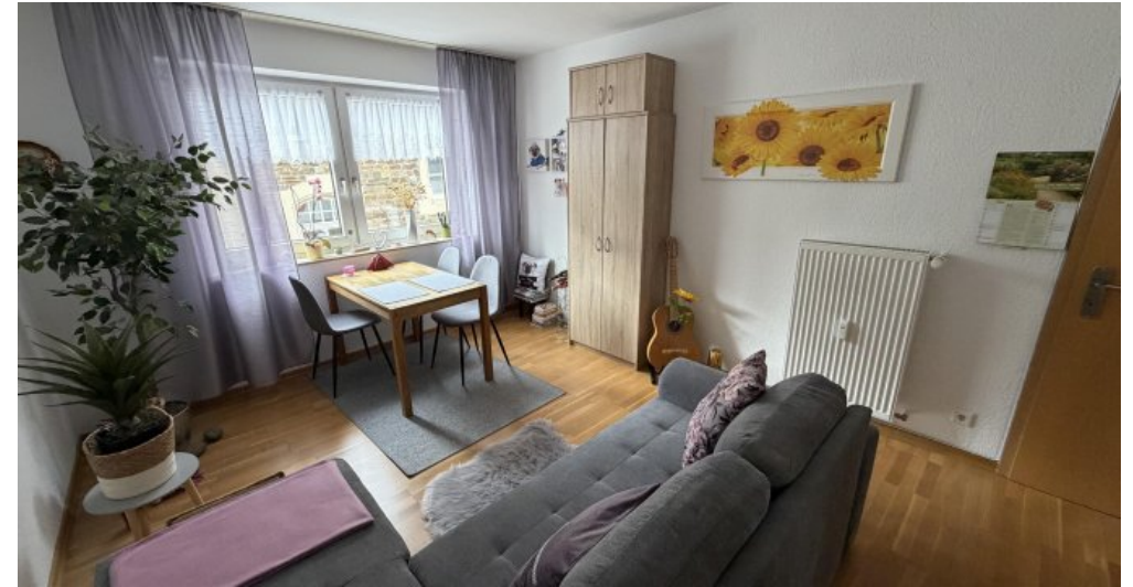
Wohnung (Nr. 2) Wohnzimmer