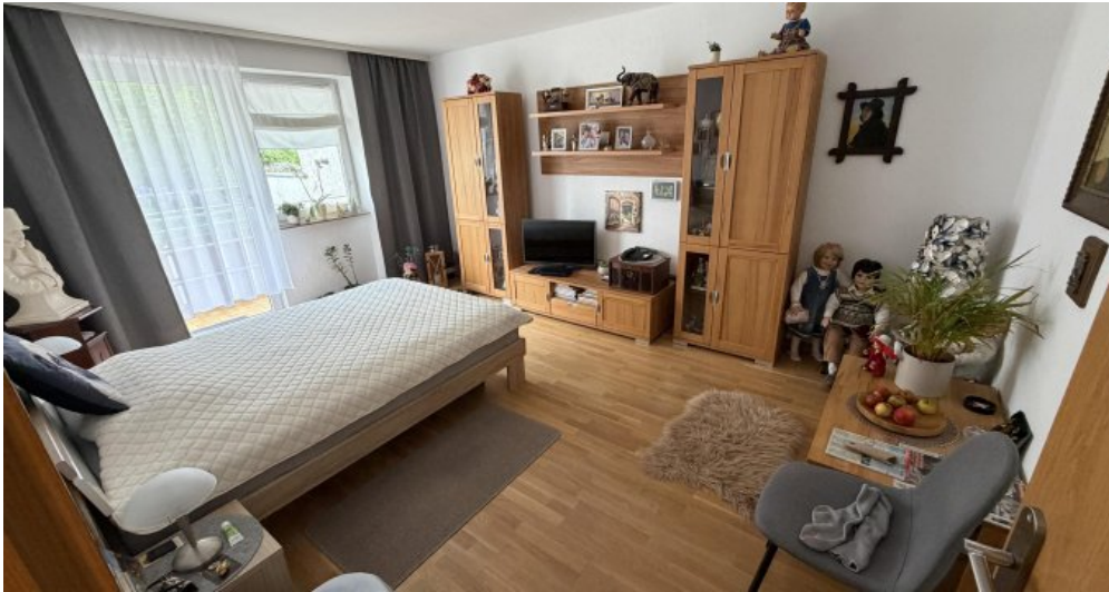
Wohnung (Nr. 2) Schlafzimmer