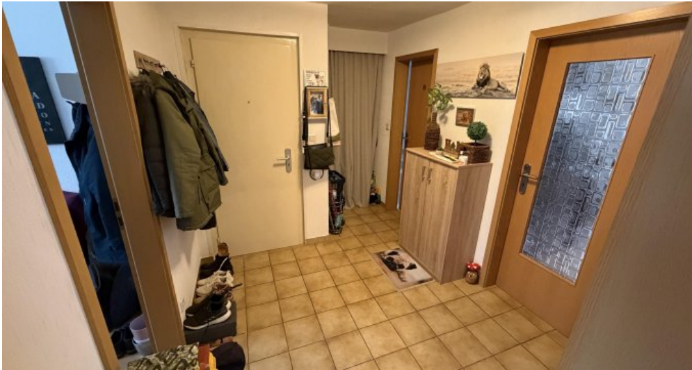
Wohnung (Nr. 2) Flur