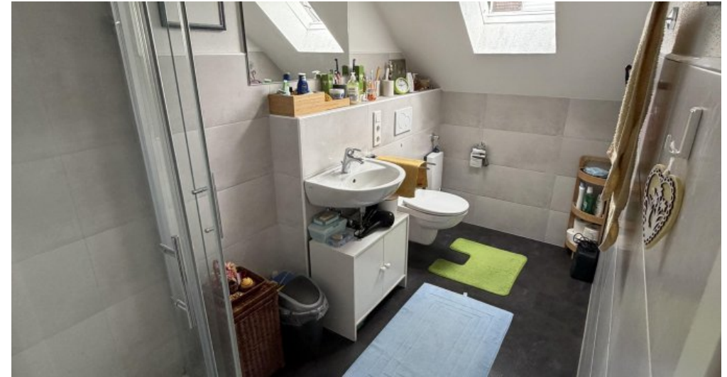
Wohnung (Nr. 6) Badezimmer