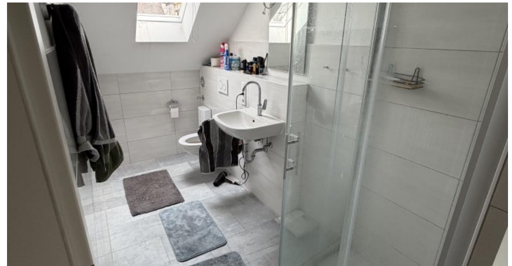
Wohnung (NR. 5) Badezimmer