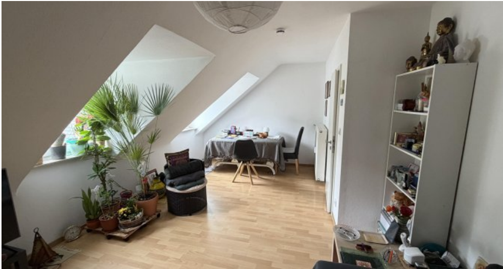
Wohnung (Nr. 6) Wohnzimmer