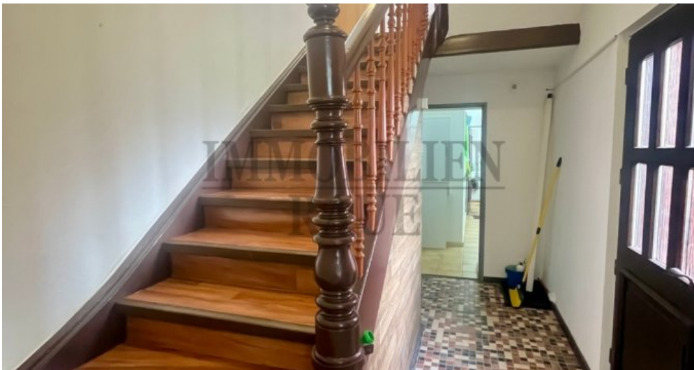
Treppenhaus (zu den Wohnungen)