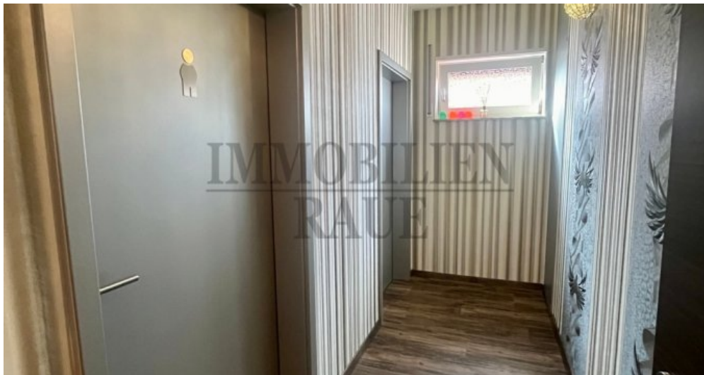
Zugang WC Anlagen