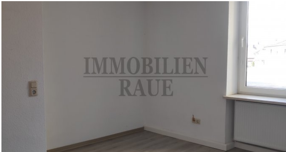
Laden im EG