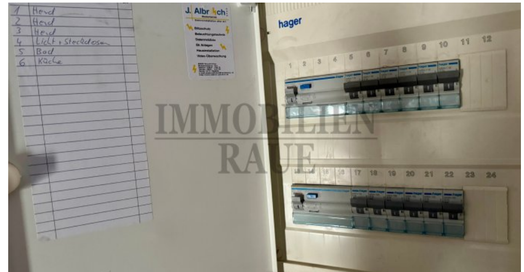
1. Obergeschoss Sicherungskasten