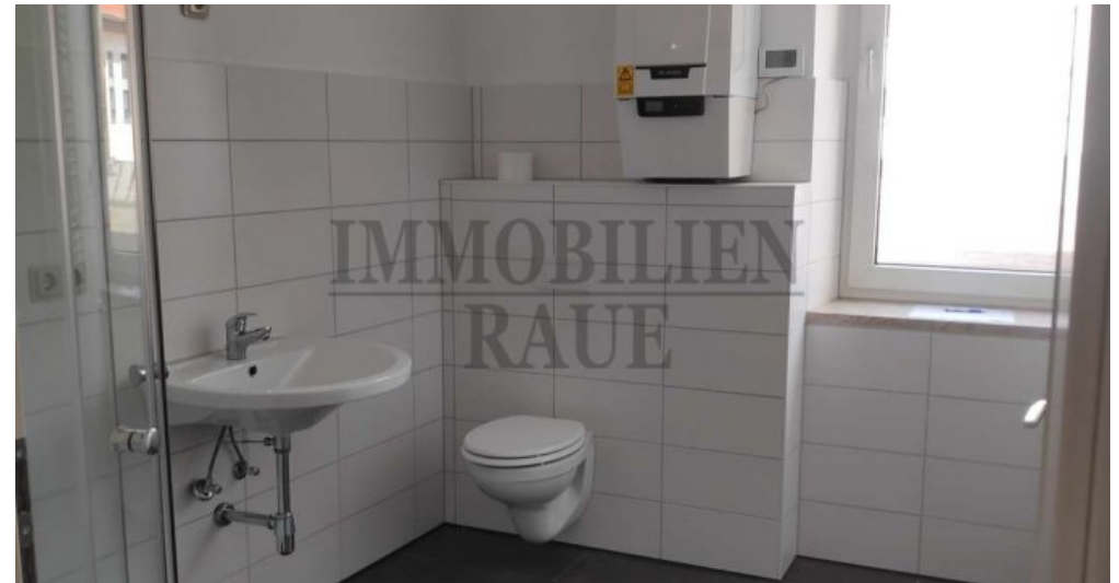
Laden im EG