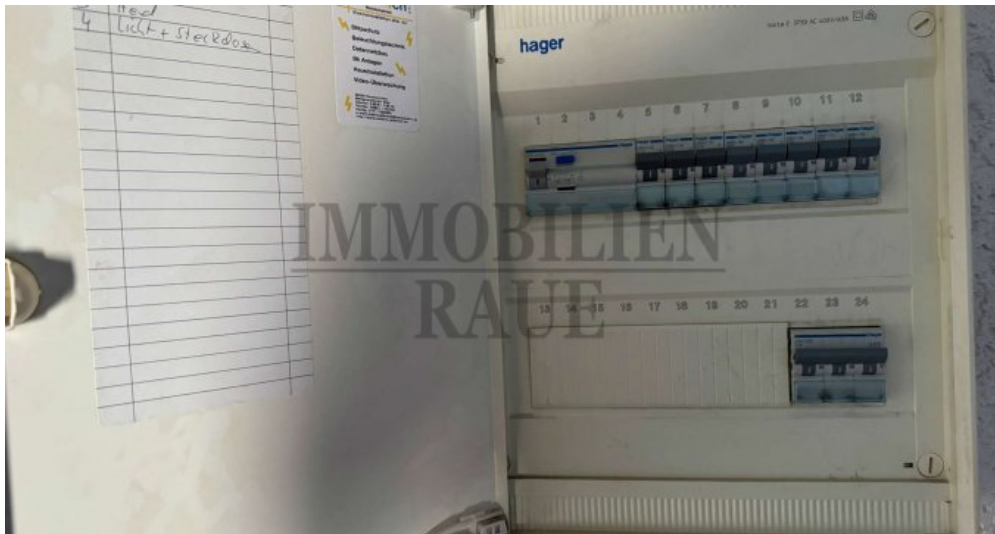
2. Obergeschoss Sicherungskasten