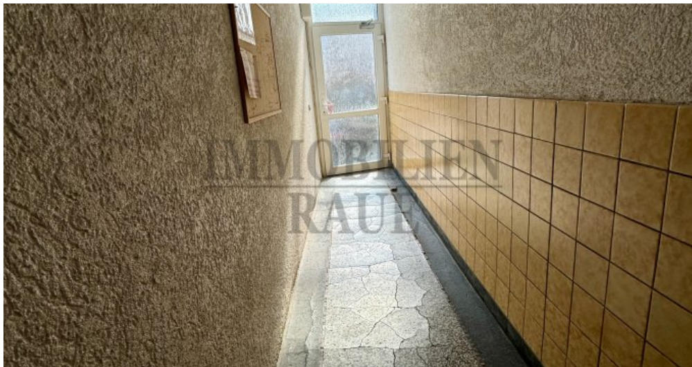
Flur im EG