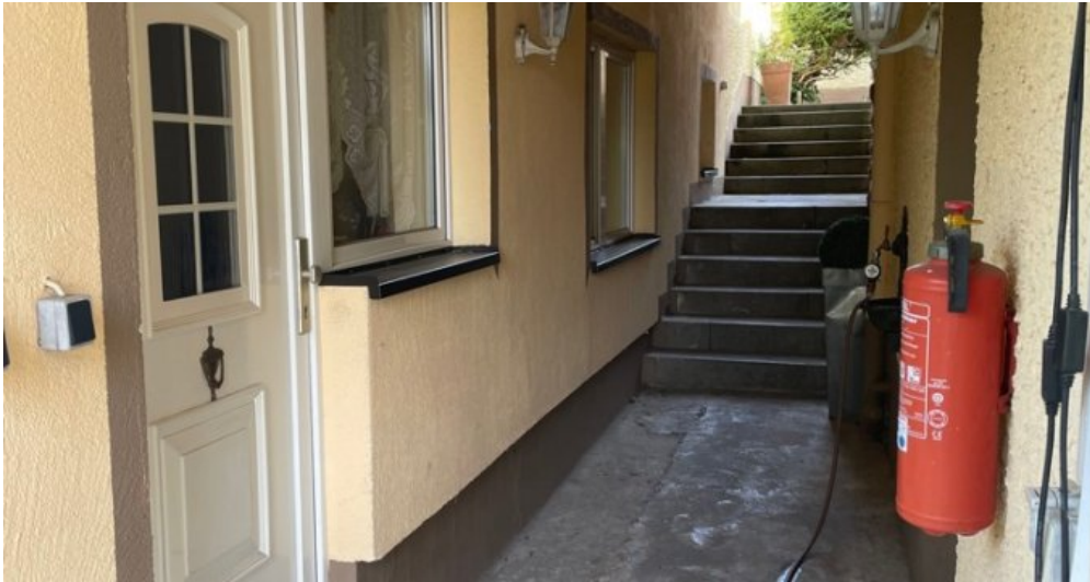
Zugang zu Wohnungen