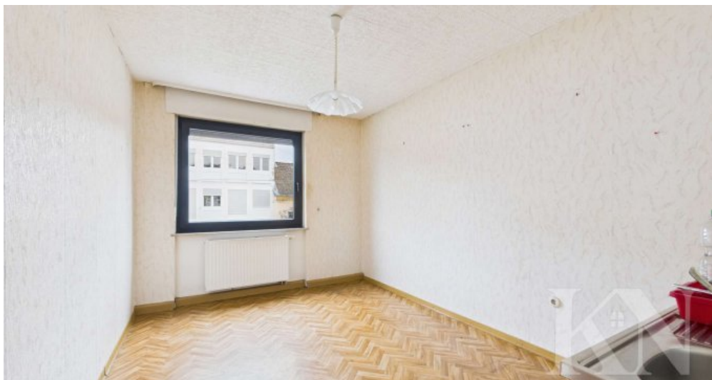
Leerstand 2. Obergeschoss rechts