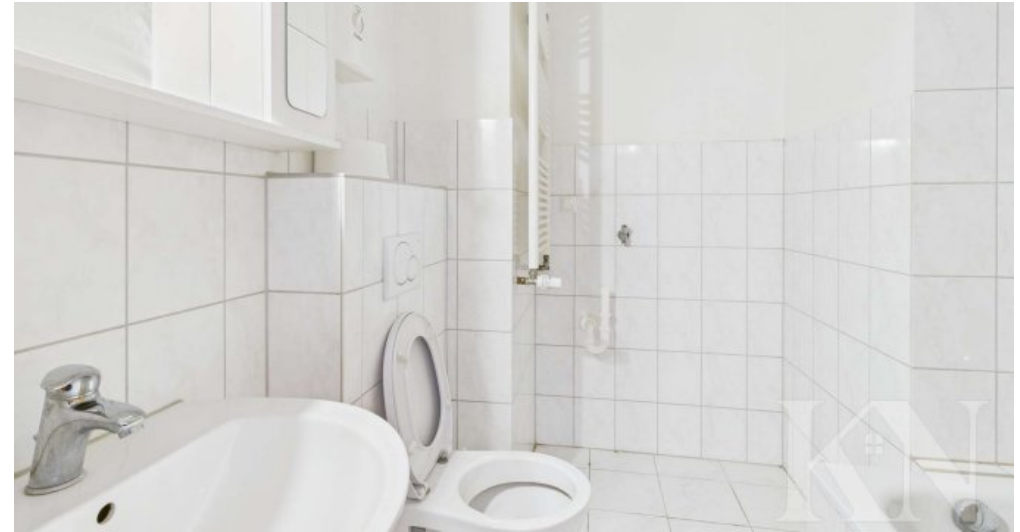
Leerstand 2. Obergeschoss rechts