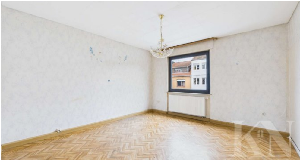
Leerstand 2. Obergeschoss rechts