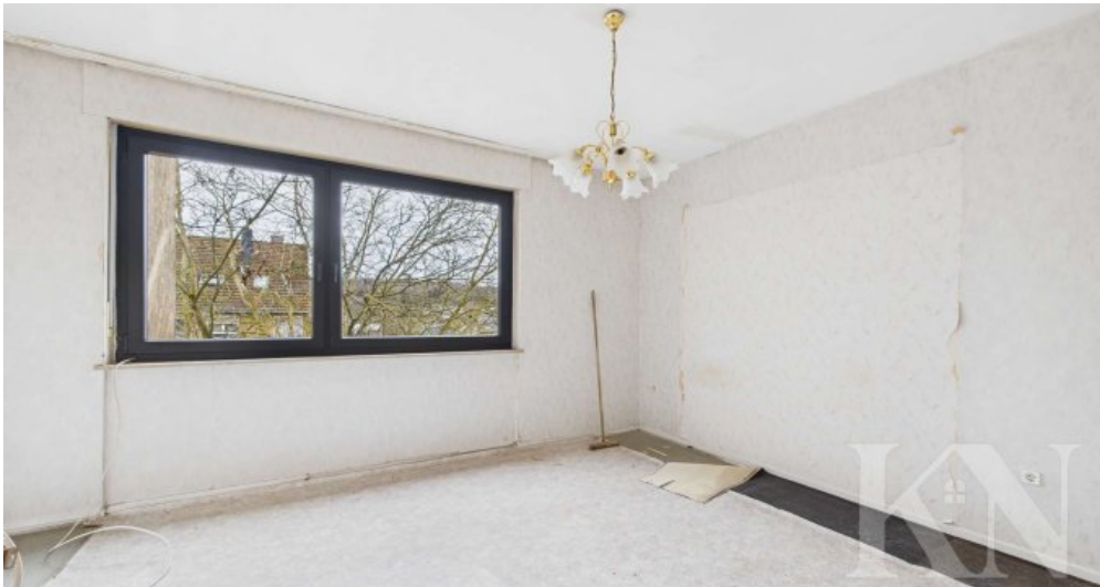
Leerstand 2. Obergeschoss rechts